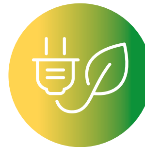
SVILUPPO DEL MERCATO INTERNO DELL'ENERGIA