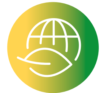
RICERCA, INNOVAZIONE E COMPETITIVITÀ