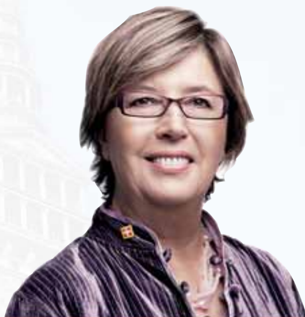
Mercedes Bresso Presidente della Regione Piemonte

A tutti loro va la gratitudine mia e della Giunta regionale.