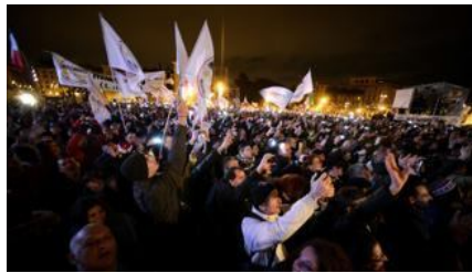
Il successo in piazza di San Giovanni a Roma, 800mila persone, e 150mila in streaming

Di sicuro, in queste elezioni, c'è solo che Grillo ha vinto. E dire vinto è poco. Le urne hanno ospitato una sollevazione di massa contro le élite. Almeno un elettore su quattro ha votato per la lista del Gabibbo Barbuto, spesso senza nemmeno avere la cortesia di anticiparlo ai sondaggisti, considerati élite anche loro. E non si può ridurre sempre tutto alla pancia, per quanto la pancia brontoli, se è vuota anche di più. Qui c'è del sentimento, non soltanto del risentimento. C'è la disperata speranza che i parlamentari a Cinque stelle siano diversi, che non rubino, ma soprattutto che ascoltino: gli altri non lo facevano più.